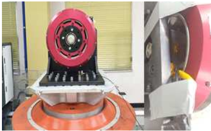
그림 1. 시험품의 설치

시험은 실제 초소형 전기차에 부착되는 상태를 모사하여 제작된 전용치구에 시험품을 장착하여 상하 방향에 한해 진행하였으며 공진점 탐색을 위한 센서는 인휠모터가 초소형자동차에 결합되는 어댑터에 부착하여 시험을 진행하였다.