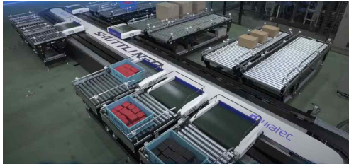
그림 1. 물류 이송 로봇 Fig. 1. logistics transport robot

그림 1은 자동화설비 중 물류 이송로봇인 스테이지 설비이다. 스테이지 설비는 모터를 사용하여 물류를 빠르고 정밀하게 이송시켜준다. 본 논문에서는 고속에서 발생하는 진동, 속도리플과 같은 다양한 외란성분을 보상해줄 수 있는 제어기를 설계하고자 한다.