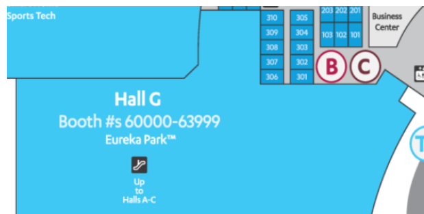
K-STARTUP 통합관 조성위치